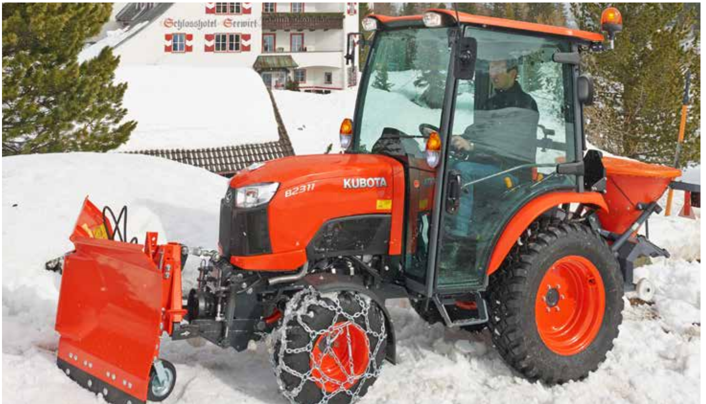
Schneeschild / Anbaustreuer